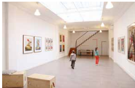
Exposition Fabula , Charles Fréger, mars 2014

Dolorès Marat Ink (exposition collective) Nigel Peake David Poullard Fredun Shapur