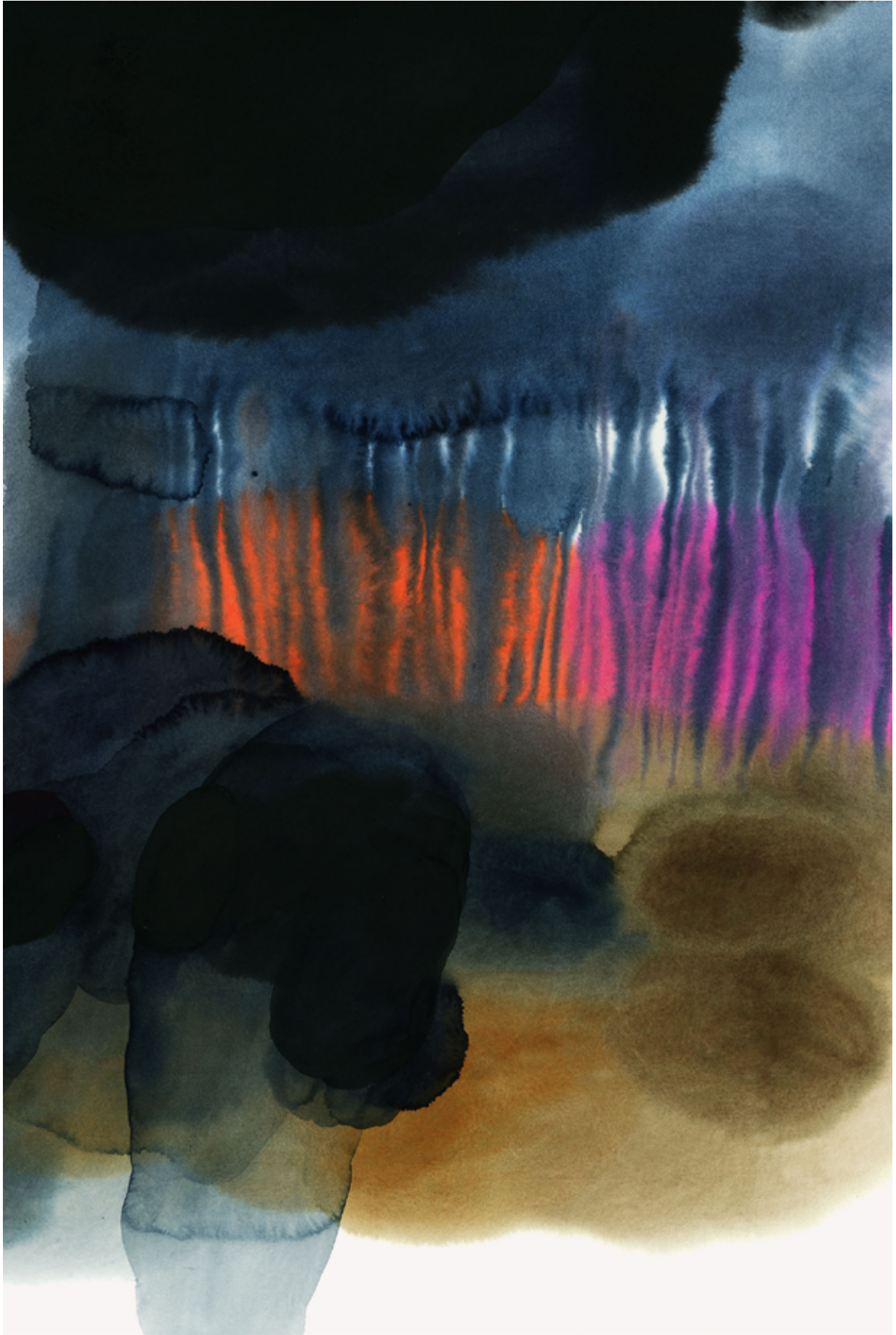
Aino-Majja Metsola, Hämähäkki (Spider) aquarelle et gouache, 2022