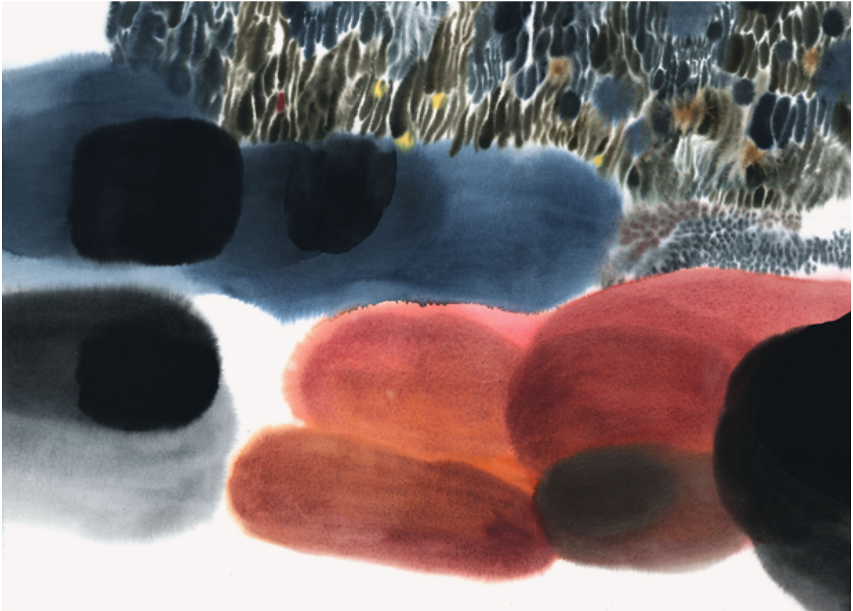
Aino-Maija Metsola, Lämpäre (Puddle) aquarelle et gouache, 2021