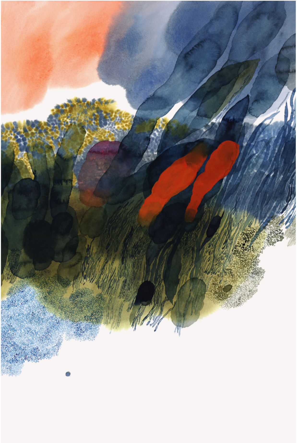
Aino-Maija Metsola, Märkää (Wet) 01 aquarelle et gouache, 2019